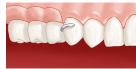
Prothèse en place